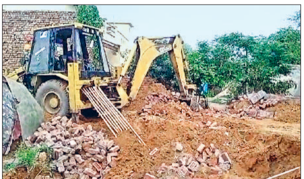
खरखोटा। निर्माणाधीन चार दीवारी को गिराती जेसीबी।