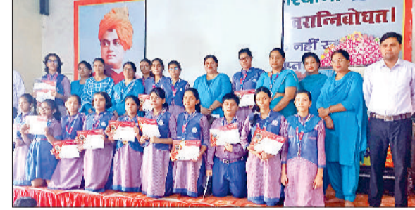
गोहाणा। विजेता विद्यार्थी अपने गुरुजनों से आशीर्वाद लेते हुए।