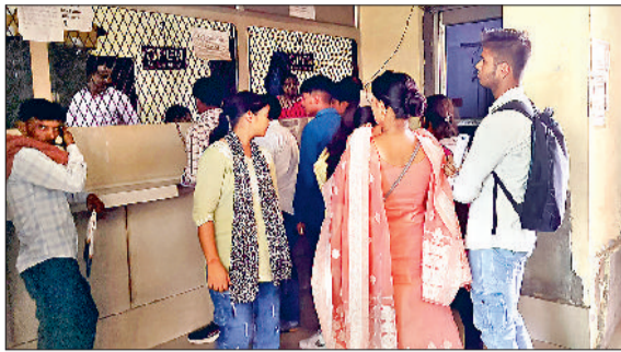
सोनीपत। स्नातक पाठ्यक्रम में दाखिले के लिए पहली वरियता सूची जारी होने पर कालों में उमड़े विद्यार्थी।