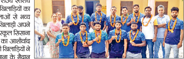
नेटबॉल विजेता खिलाड़ियों का हुआ मठ्य स्वागत।