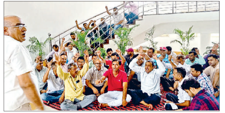
सोनीपत। डीक्रेस्ट में विरोध प्रदर्शन करते यूनियन के पदाधिकारी एवं सदस्यगण।

मांगों की सुनवाई न होने के कारण विश्वविद्यालय में अनिश्चितकालीन धरना ऐलान