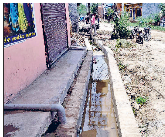
गन्जौर। सनपेड़ा रोड पर पानी निकासी के लिए बनाए गए नाले।

सनपेड़ा रोड पर पीडब्ल्यूडी विभाग द्वारा पानी निकासी के लिए नालों का निर्माण शुरू कर दिया गया है। नाले के निर्माण के बाद सड़क का नवनिर्माण कार्य शुरू किया जाएगा। जीटी रोड से रामनगर वाया सनपेड़ा सड़क मार्ग पर 3 करोड़ 30 लाख रुपये खर्च किए जाएंगे। जीटी रोड से लेकर गांव सनपेड़ा व रामनगर तक की करीब 6 किलोमीटर सड़क की हालत बहुत ही जरूर है। सड़क मार्ग पर वाहन चालकों को गुजरने में