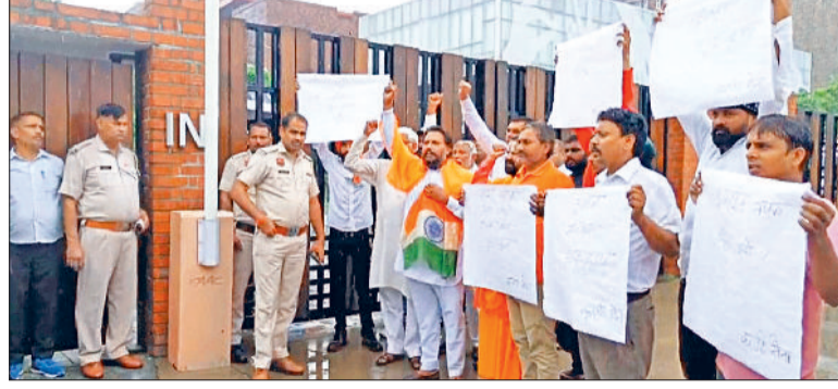
राई। विवि के गेट पर पहुंचकर विवि प्रशासन के खिलाफ रोष जताते और हनुमान चालीसा का पाठ करते हुए हिंदू संगठन।

राजीव गांधी एजुकेशन सिटी स्थित निजी विश्वविद्यालय में पिछले दिनों कुछ विद्यार्थियों की तरफ से फिलिस्तीन पोशाक पहनकर फिलिस्तीन के पक्ष में नारेबाजी की गई थी। इसका वीडियो सोशल मीडिया पर वायरल हो गया था। इसके विरोध में हरकत में आए हिंदू संगठनों ने मंगलवार को विवि के गेट पर पहुंचकर विवि प्रशासन के खिलाफ रोष जताया और हनुमान चालीसा का पाठ भी किया। सोशल मीडिया पर एक वीडियो वायरल हुआ था, जिसे सोनीपत के राई स्थित निजी विश्वविद्यालय का बताया गया था। इस वीडियो में कुछ विद्यार्थी फिलिस्तीन देश के नागरिकों जैसी पोशाक पहने थे और उस देश के पक्ष में नारेबाजी करते दिखाई दे रहे थे। इस वीडियो का कई