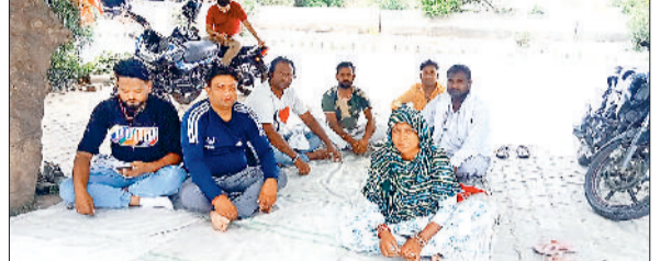
सोनीपत। भूख हड़ताल पर बैठे सफाई कर्मचारी।

सरकार द्वारा अनुमति ली गई है या नहीं। करने दिया जाएगा। विभाग द्वारा जिला के किसी भी अवैध कालोनी का निर्माण नहीं सभी क्षेत्रों में नजर रखी जा रही है।