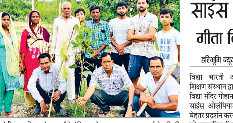
सोनीपत। अभियान के तहत पौधे रोपित करते हुए।