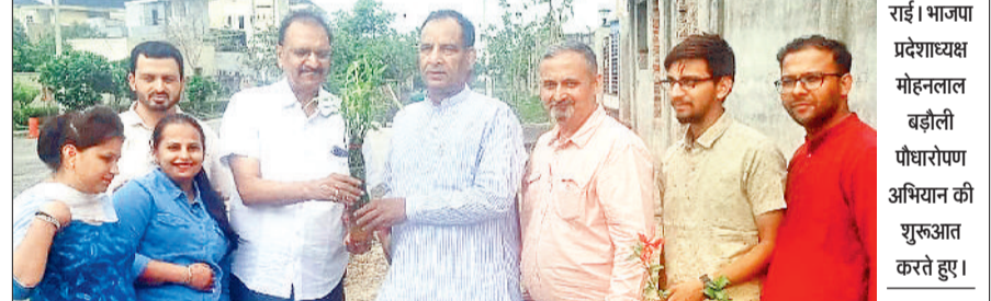
राई। भाजपा प्रदेशाध्यक्ष मोहनलाल बड़ोली ने पौधारोपण अभियान की शुरुआत करते हुए।

जीटी रोड स्थित एलडीको सिटी स्थित संजोग अस्पताल में पौधारोपण अभियान की शुरुआत की गई। भाजपा के नवनिर्वाचित प्रदेशाध्यक्ष एवं राई के विधायक मोहन लाल बड़ोली ने पौधारोपण करके अभियान की शुरुआत की। इस दौरान अस्पताल के चिकित्सकों व स्टाफ द्वारा 75 पौधे रोपित किए