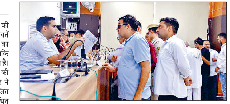
सोनीपत। समाधान शिविर के दौरान लोगों की शिकायतें सुने अधिकारीगण।

जिले में लगाए जा रहे समाधान शिविर की कड़ी में मंगलवार को कुल 177 शिकायतें प्राप्त हुईं। इनमें से केवल 13 शिकायतों का ही मौके पर समाधान संभव हो पाया, बाकि की 164 शिकायतों को लंबित रखा गया है। जिला स्तरीय समाधान शिविर की अध्यक्षता उपायुक्त डा. मनोज कुमार ने की, वहीं उपमंडल स्तर पर आयोजित समाधान शिविर की अध्यक्षता संबंधित एसडीएम ने की। वहीं आज तक की कुल शिकायतों की बात करें तो मंगलवार तक कुल 2263 शिकायतें प्राप्त हुई थीं। इसमें से 928 का समाधान हो गया है, जबकि 1271 शिकायतें लंबित हैं। मंगलवार को